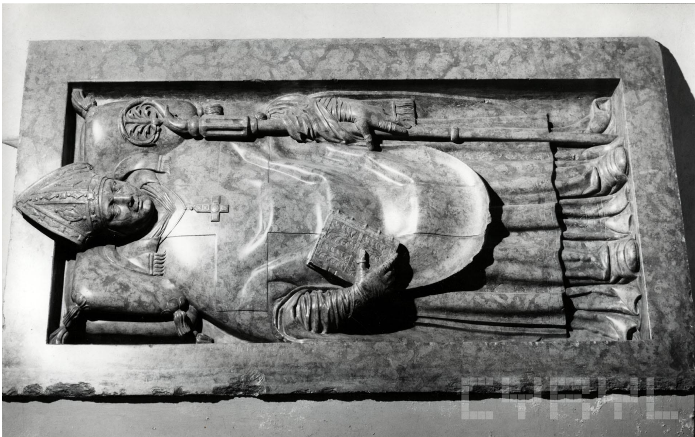
, sygn. CYRYL_18_10_2_10_0001