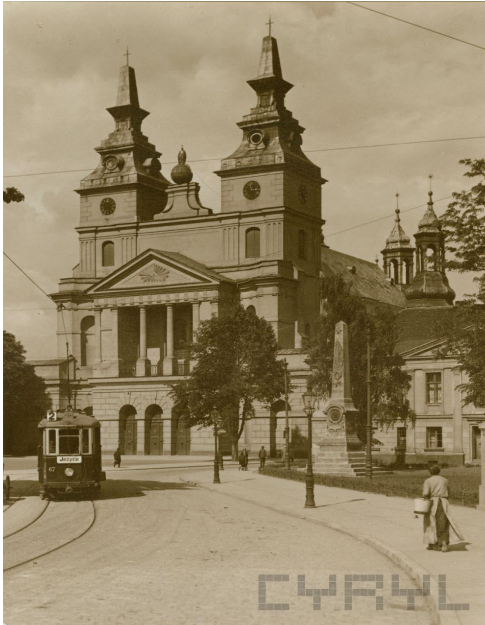
sygn. CYRYL_18_1_3_0005