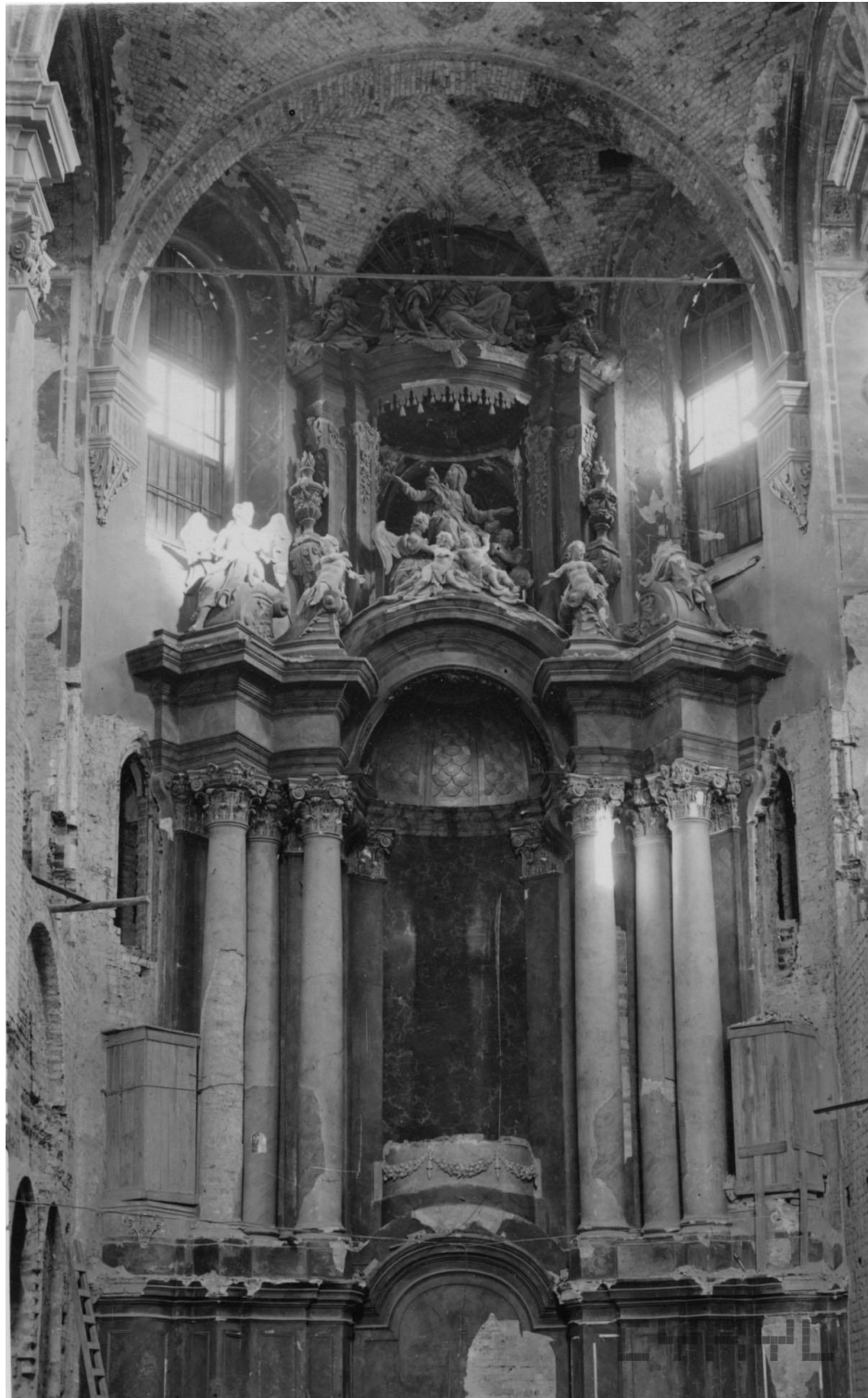
Własność Miejskiego Konserwatora Zabytków w Poznaniu. Zdjęcie pochodzi z: www. cyryl.pl , sygn. CYRYL_18_10_1_9_0004