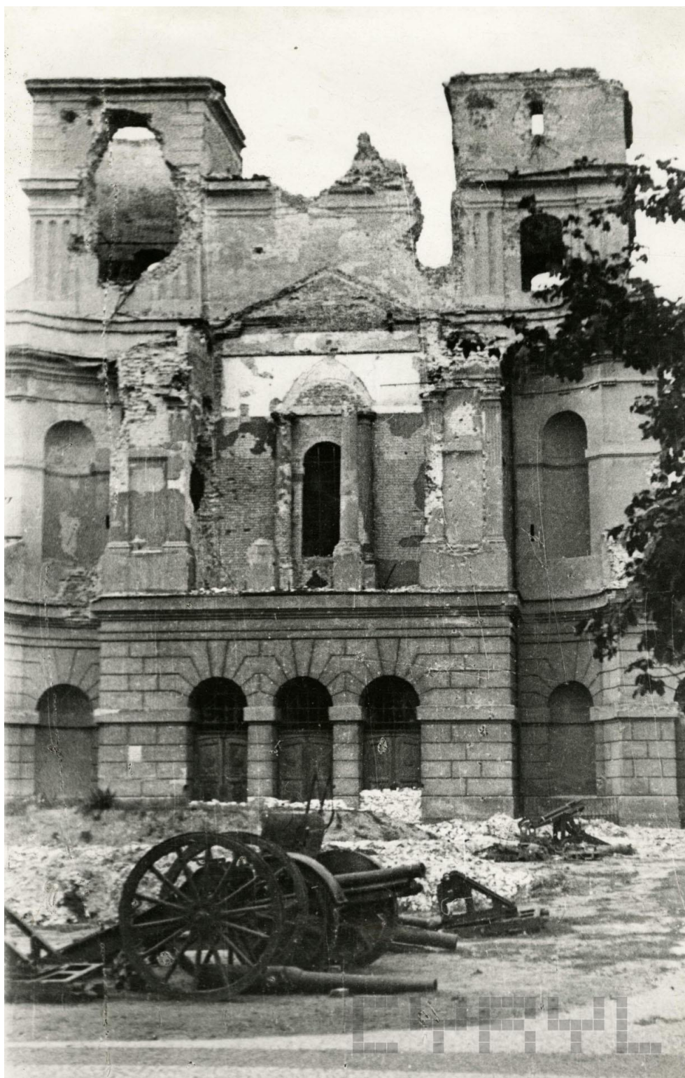
sygn. CYRYL_18_10_1_1945_4_0002