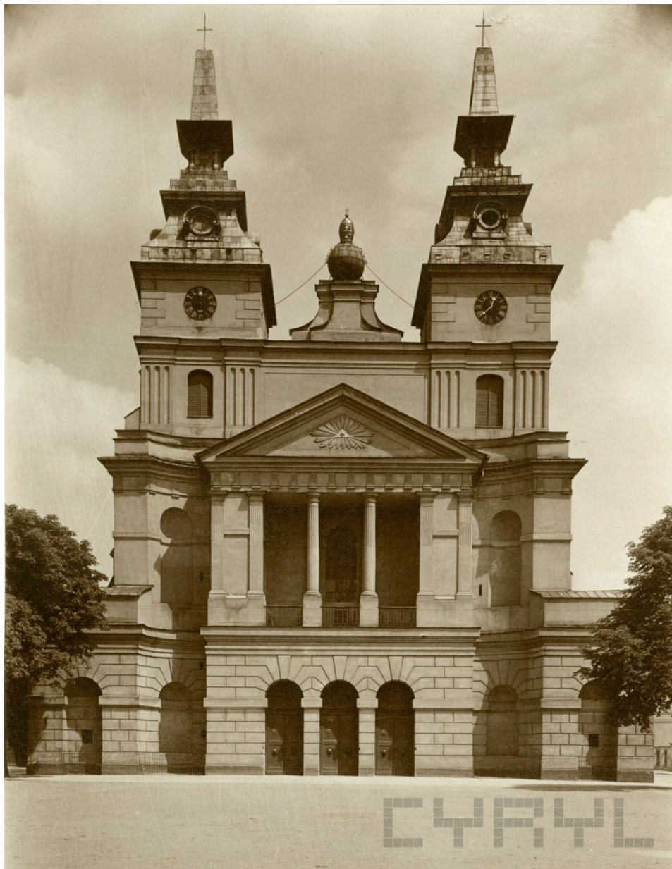
Fot. Roman Stefan Ulatowski. Zdjęcie pochodzi z: www. cyryl.pl , sygn. CYRYL_18_1_3_0006