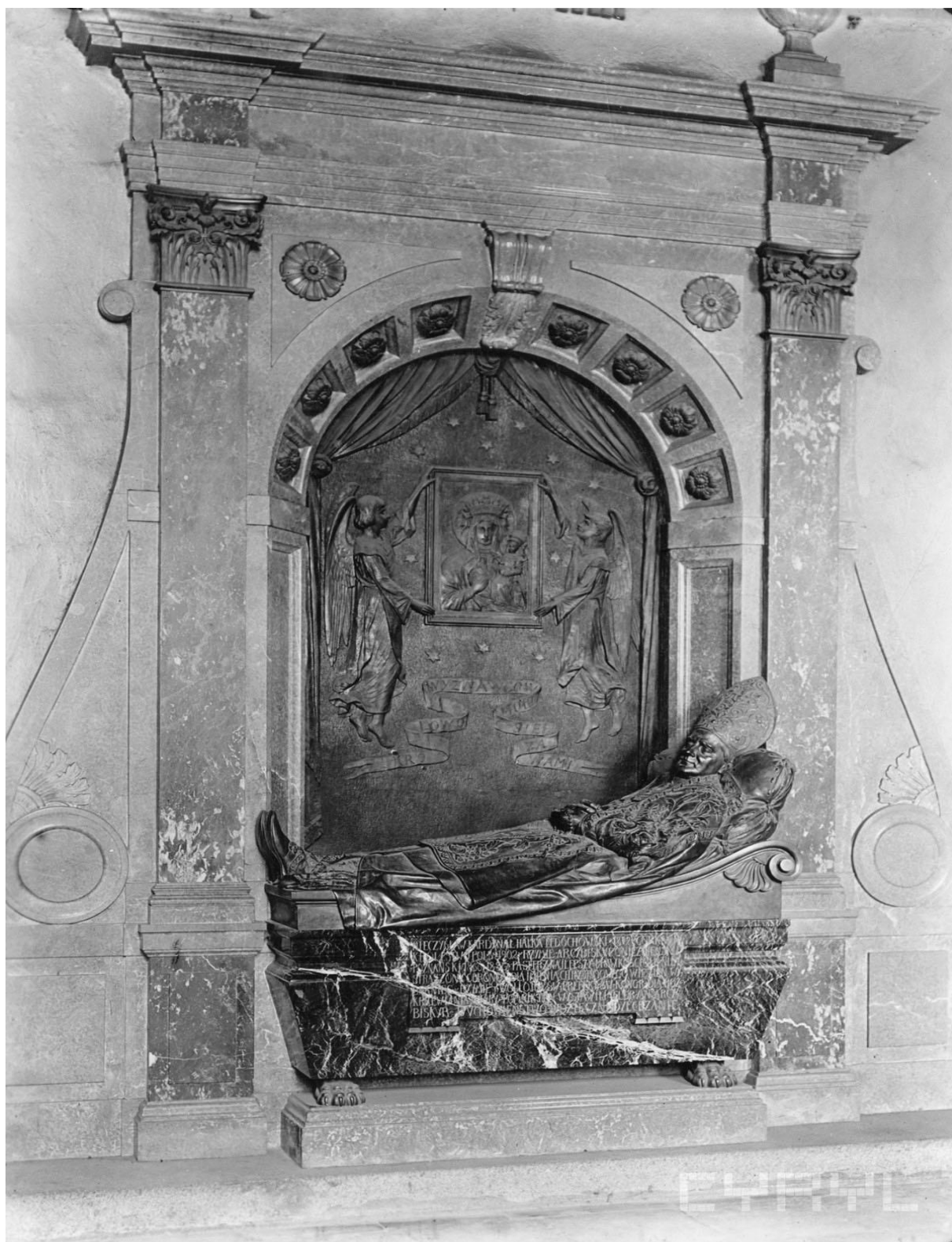
Fot. Roman Stefan Ulatowski. Własność Miejskiego Konserwatora Zabytków w Poznaniu. Zdjęcie pochodzi z: www. cyryl.pl , sygn. CYRYL_18_10_2_22_0046