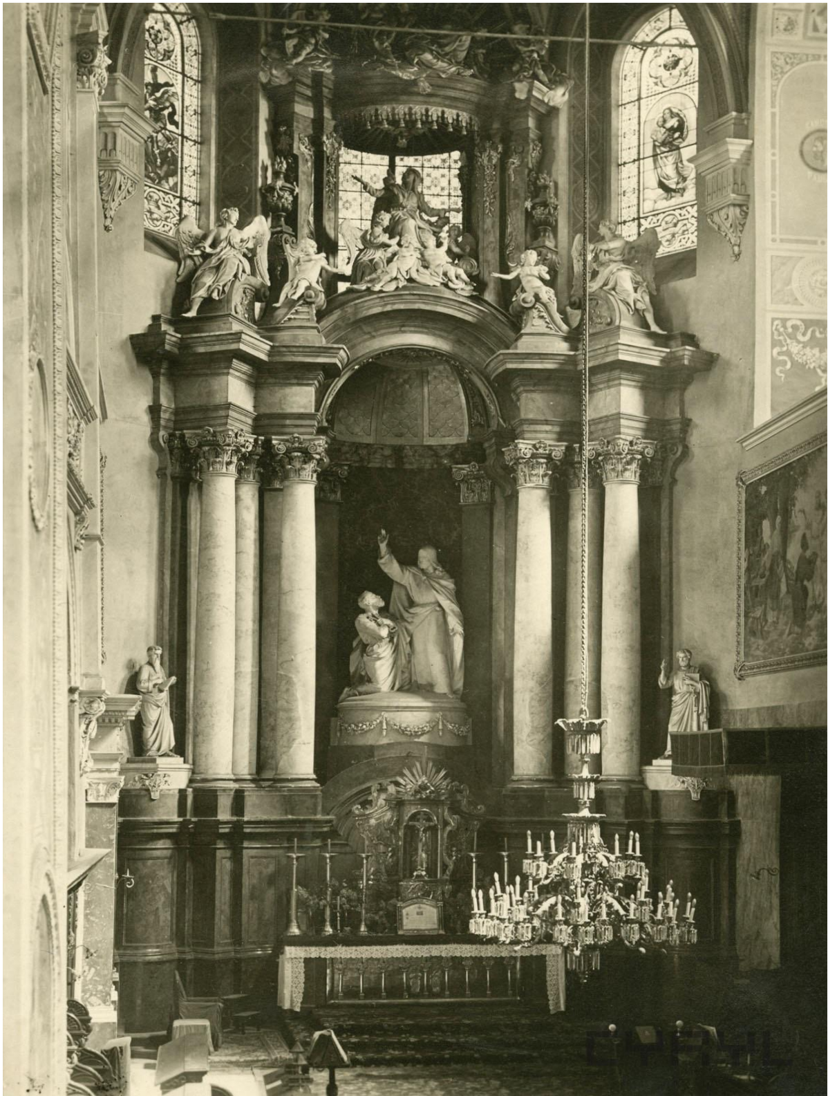
Fot. Roman Stefan Ulatowski. Własność Miejskiego Konserwatora Zabytków w Poznaniu. Zdjęcie pochodzi z: www. cyryl.pl , sygn. CYRYL_18_10_1_9_0001