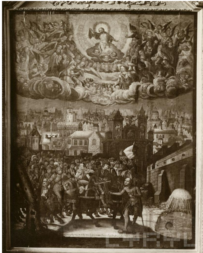
Fot. Roman Stefan Ulatowski. Własność Miejskiego Konserwatora Zabytków w Poznaniu. Zdjęcie pochodzi z: www. cyryl.pl , sygn. CYRYL_18_1_3_0044